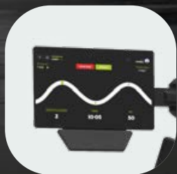
Pack connectivité avec écran 9" et NFC (en option)

Notre gamme d'équipements de musculation haut de gamme avec une meilleure précision d'exercice et une qualité supérieure. Découvrez toutes les actualités >>>