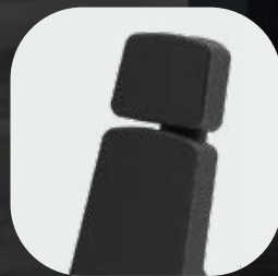
Finitions en fibres carbone