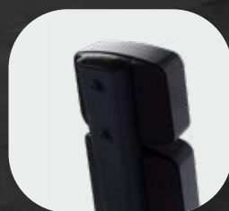
Recouvert de ABS injecté