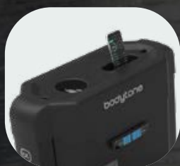
Support pour bouteilles et mobiles