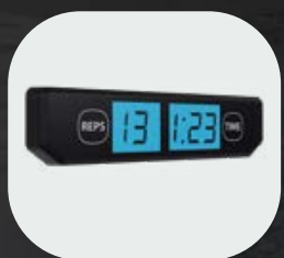
Compteur de répétitions