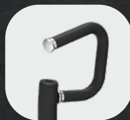
Poignées antidérapantes en PVC