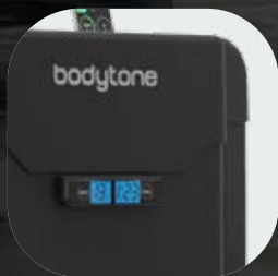
Couvertures thermoplastiques de haute qualité