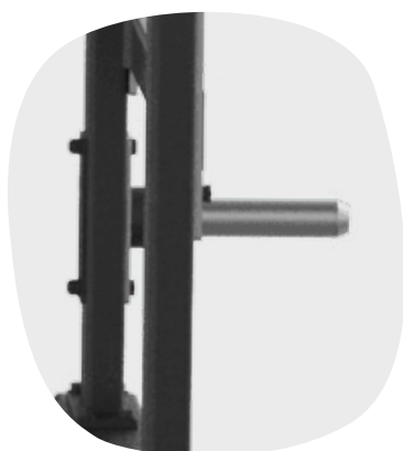
SUPPORTS DE RANGEMENT EN ACIER