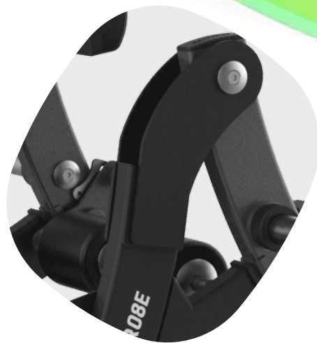
STRUCTURE EN ACIER ROBUSTE ET FERME