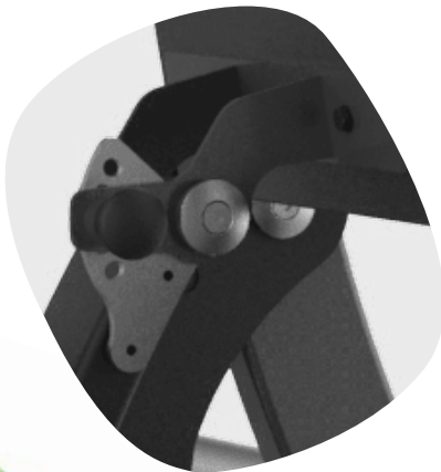
SIÈGE RÉGLABLE À DIFFÉRENTES HAUTEURS